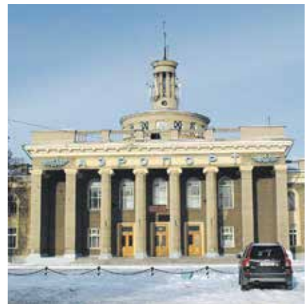
ЭТО ФОТО ИНТЕРАКТИВНОЕ. Загрузите приложение «Наведи», наведите мобильное устройство на изображение и оно «оживёт»

В ближайшее время проект обсудят на градостроительном совете и представят общественности.