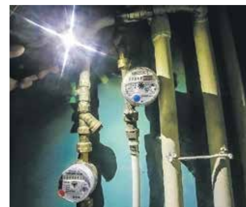
Жулики уверяют граждан, что счётчики пора менять