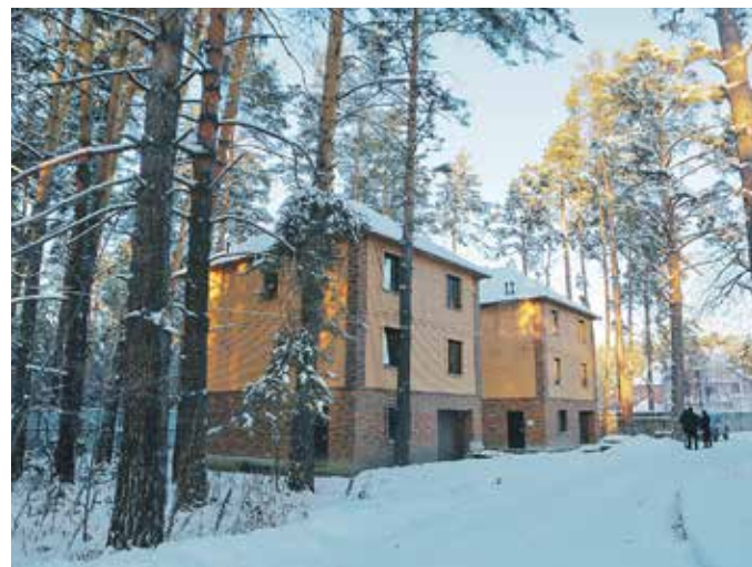
На землях, которые должны принадлежать городу, уже построены дома

В результате инвентаризации только по территории Завельцовского бора был подан 21 судебный иск из-за незаконного присвоения земли, некоторые факты мошенничества были доказаны, и по ним уже вынесены приговоры. Было установлено несколько схем хищения земельных участков. Одна из них заключалась в выкупе земельного участка под