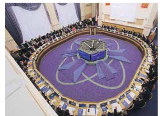
Депутаты горсовета приняли бюджет города на предстоящий год | ФОТО РОСТИСЛАВА НЕТИСОВА

В нём предусмотрены затраты на строительство школ и решение проблем обманутых дольщиков.