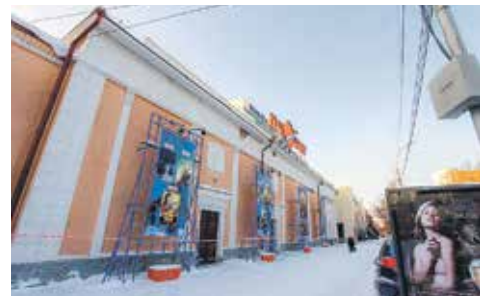
Здание бывшего кинотеатра построено в начале XX века и требует особого внимания при ремонте

Ранее здание, построенное в 1935 году, занимал кинопрокатчик «АртСайнс Синема Дистрибушн», который покинул его по решению суда в 2016. Городские власти надеются, что театр Афанасьева сможет переехать в новый дом в 2019 году.