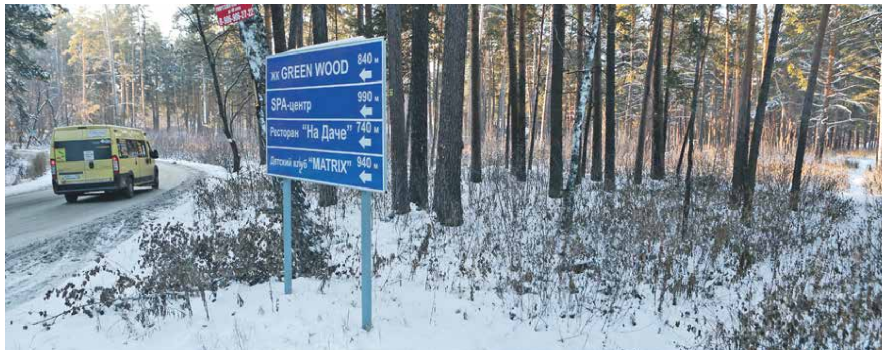
Законные постройки на виду и на указателях, а незаконные прячутся в чаще леса