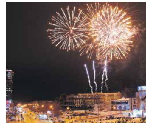
Фейерверк во дворе надо запускать по всем правилам