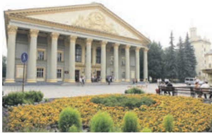
Развитие зелёных зон зависит от градостроительной политики и существующих правил землепользования и застройки

Благодаря сформированной концепции развития зелёных зон Новосибирска на 2017–2020 годы у нас появилась возможность работать с инвесторами. В результате за год разработана финансовая схема, а за летний сезон 2016 года проведена полная реконструкция «Сада Дзержинского». Ранее над каждой аллеей этого парка шеф-