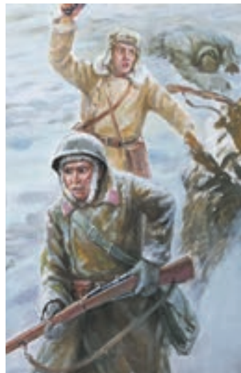
Фрагмент диорамы новосибирского художника-фронтовика

Филиал Городского центра изобразительных искусств, посвящённый Великой Отечественной войне, откроется 8 мая в Новосибирске.