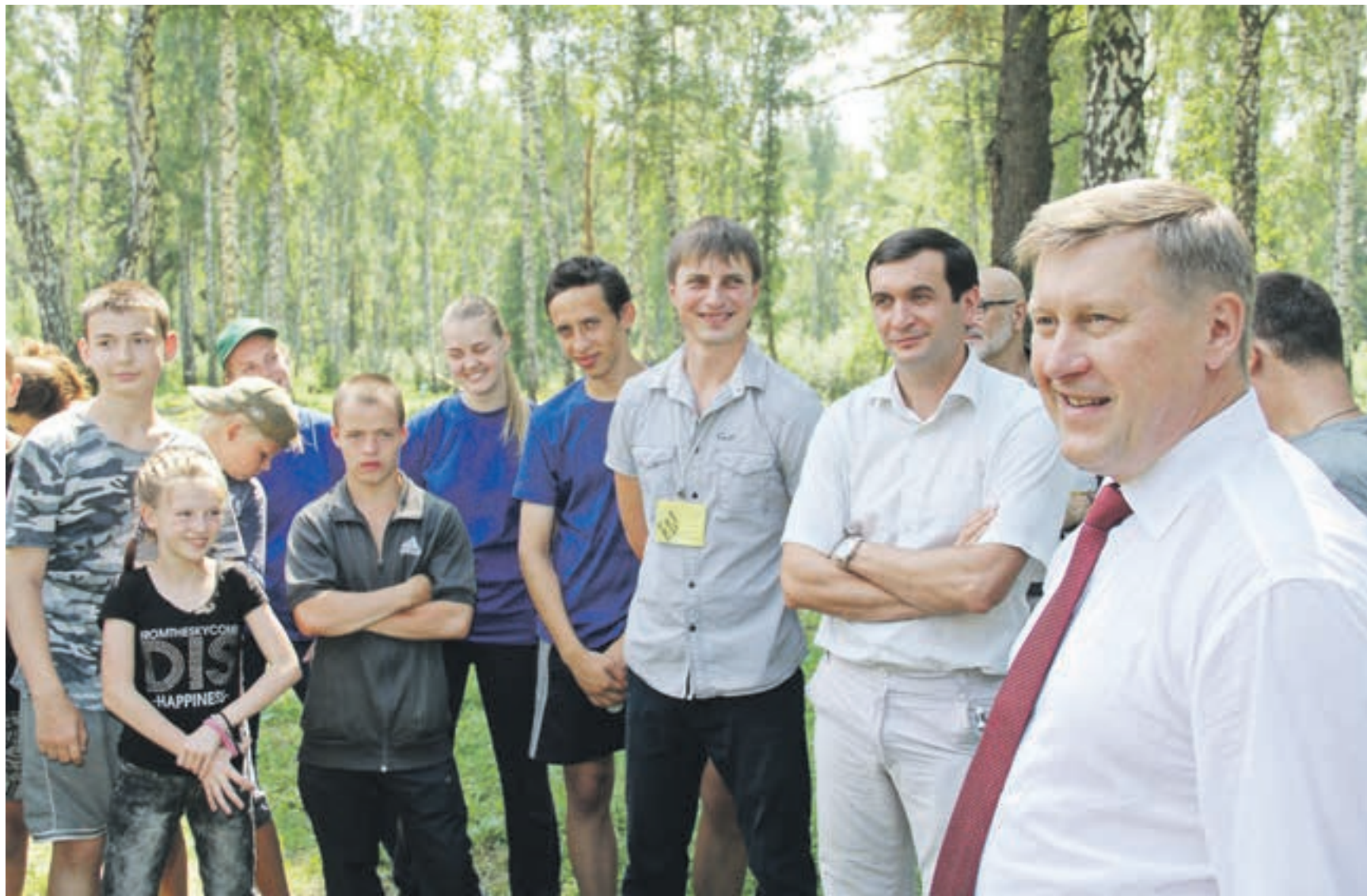
«Зелёный город» должен стать приоритетом для всех: от власти до горожан