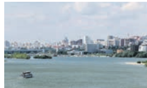
Прогулки по Оби на речных паромоходах начнутся 1 мая

Навигация на акваториях Обского водохранилища для маломерных судов откроется в первой декаде мая.