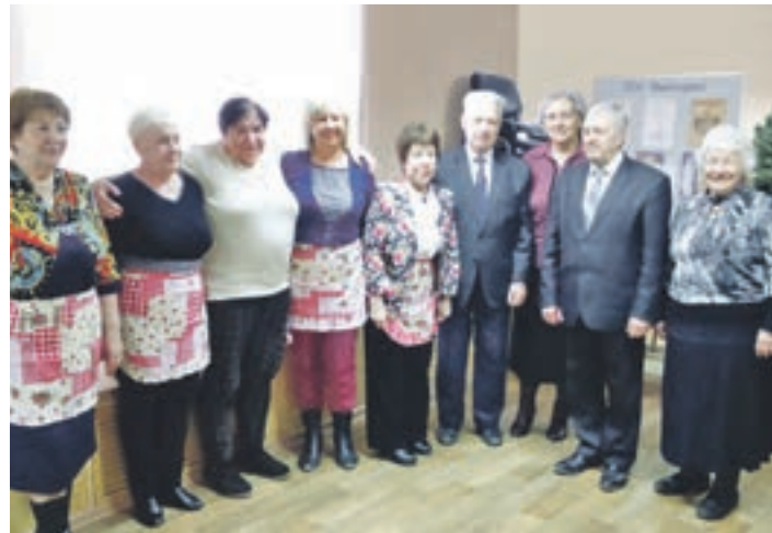
Ветераны Центрального района начали цикл встреч по подготовке к 35-летию своей ветеранской организации

Также прошло заседание клуба «Ветеран» с повесткой дня «Истории семейных династий жителей нашего города» и концерт студентов Новосибирского государственного театрального института. Твёрдо и однозначно должно и нужно усвоить будущим участникам заседаний клуба, что тот, кто не бывает на подобных мероприятиях, много теряет в познании и оценке красоты, значимости, величия жизни, дел и подвигов человека в самых разнообразных сферах деятельности его.