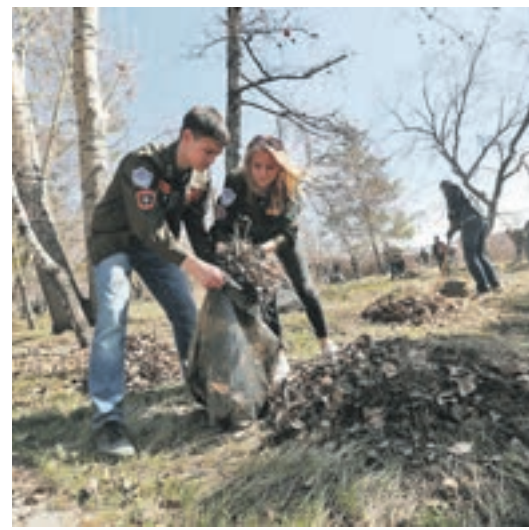
На уборку набережной пришли около 200 бойцов Новосибирского штаба студенческих отрядов, местные жители и городские власти