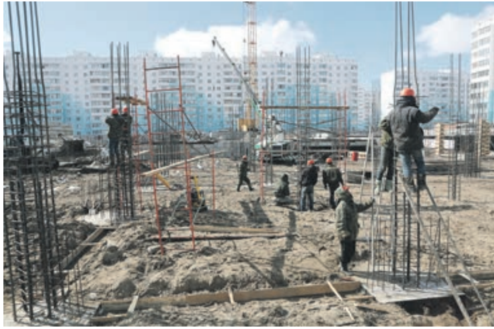
На строительной площадке уже вырыт котлован, забиты сваи, сделан ростверк, возведены стены подвала

В «Чистой Слободе» продолжается строительство новой школы, рассчитанной более чем на 1000 учеников. Работы ведутся в партнёрстве с застройщиком.