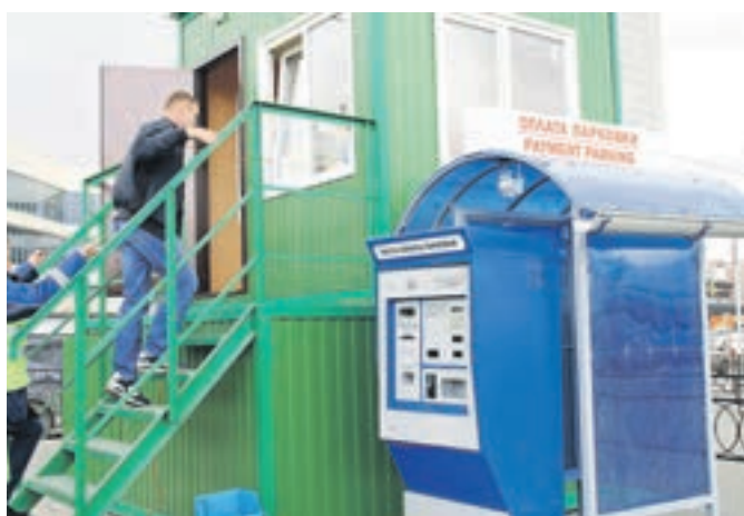
Парковка у вокзала стала первой платной парковкой, размещение на которой регулируется муниципалитетом, а не частниками

Проект платного парковочного пространства, разговоры о котором ведутся уже на протяжении пяти лет, теперь существует не только на бумаге. Первая платная парковка в центре Новосибирска открылась на площади у вокзала «Новосибирск-Главный».