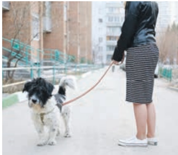
Двор в микрорайоне «Горский» может стать хорошим примером для собаководов

Ещё недавно разговоры об уборке за собаками во время прогулки вызывали недоумение и вялую отмашку хозяев. Сейчас же всё чаще можно заметить владельцев, которые вынимают из кармана пакетик и тщательно собирают все «сюрпризы» своего любимца.