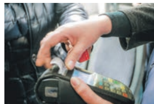
В феврале оплата по безналичному расчёту обогнала расчёты наличными в муниципальном транспорте Новосибирска

Новосибирск одним из первых в стране перешёл на безналичный расчёт за проезд на общественном транспорте. Его пример обсудили на научной конференции по развитию безналичной оплаты в общественном транспорте с руководителями профильных департаментов и перевозчиками городов Сибири и Дальнего Востока.