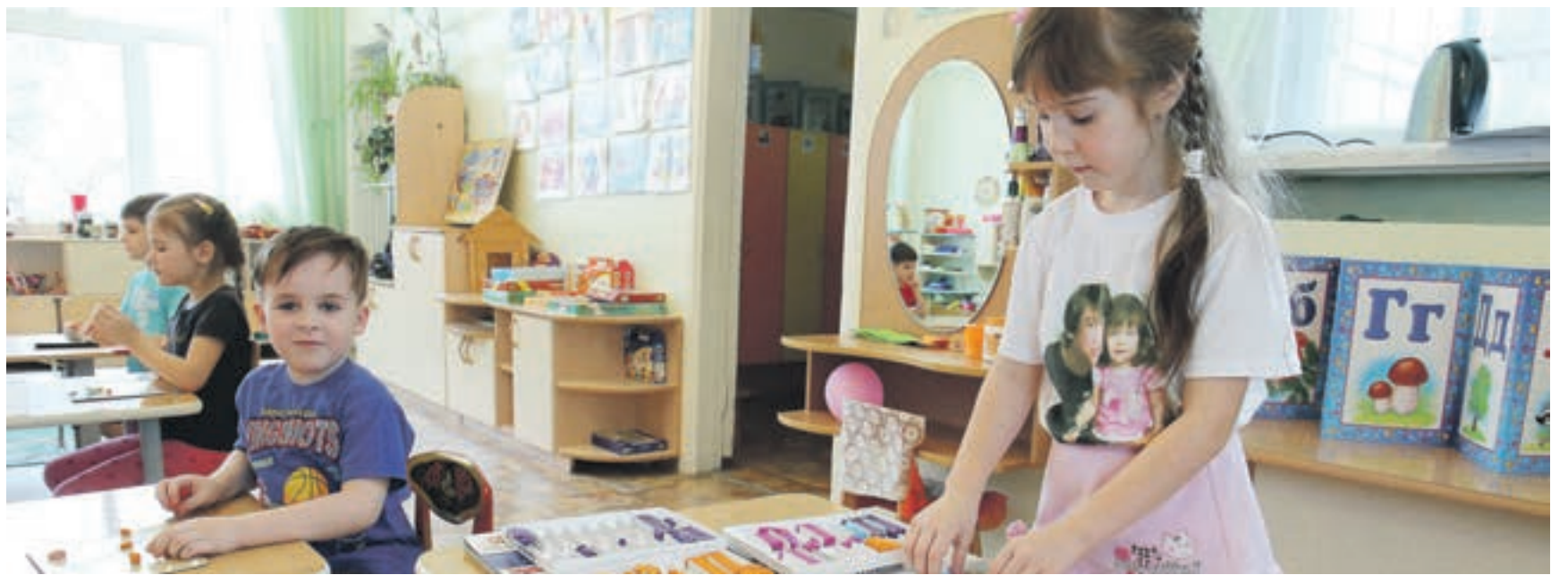
В конце мая в детских садах освободится более 16 000 мест

В Новосибирске 1 мая стартует набор групп в детские сады. Причина — более 16 000 мест, которые освободятся в конце месяца.