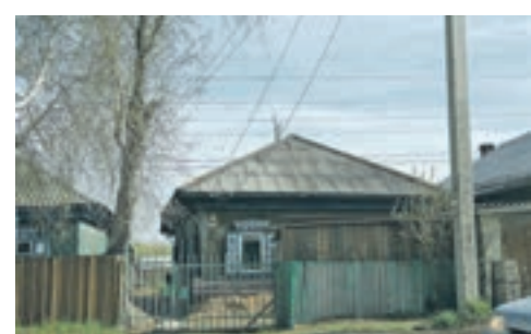
В межсезонье внешний вид частного сектора зависит больше не от муниципалитета, а от самих жителей