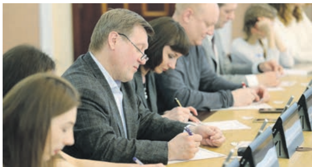
В Новосибирске свою грамотность проверили 6930 тысяч горожан, в том числе и мэр

По всей России и за её пределами 8 апреля состоялась акция «Тотальный диктант». В ней приняли участие около 7 000 новосибирцев.