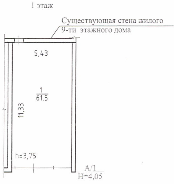
Схема расположения помещений