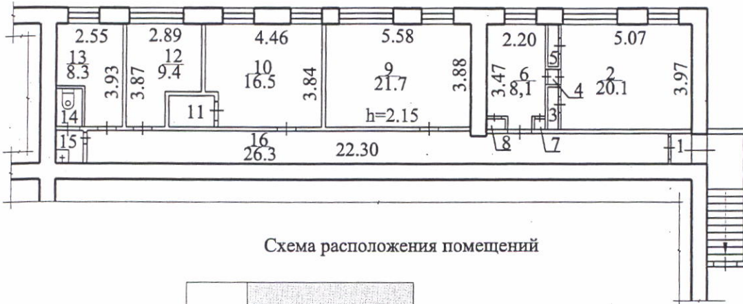
Схема расположения помещений