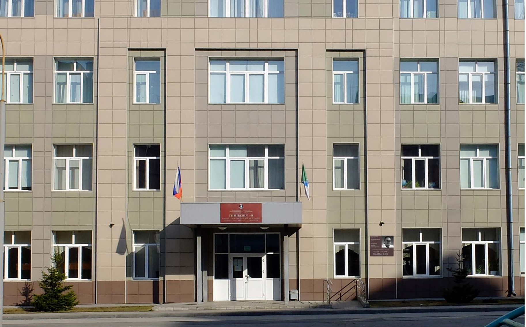
эскиз мемориальной доски В. П. Казначееву для фасада здания МБОУ гимназии №9 материалы: плита - гранит дымовский, 900 x 750мм, портрет габбро. скульптор А. Дьяков Новосибирск 2021г.