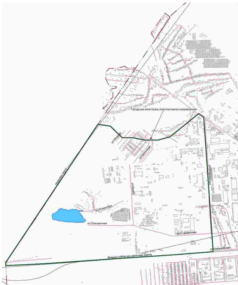
СХЕМА границ территории, прилегающей к ул. Станционной (западный въезд в город), в Ленинском районе