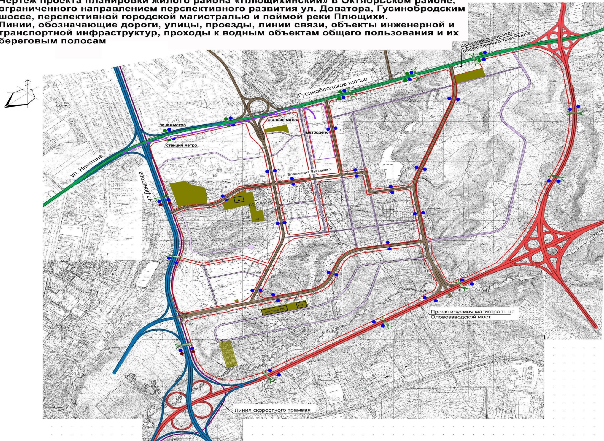
Классификация улично-дорожной сети

Приложение 2 к проекту планировки жилого района «Плющихинский» в Октябрьском районе, ограниченного направлением перспективного развития ул. Доватора, Гусинобродским шоссе, перспективной городской магистралью и поймой реки Плющи.