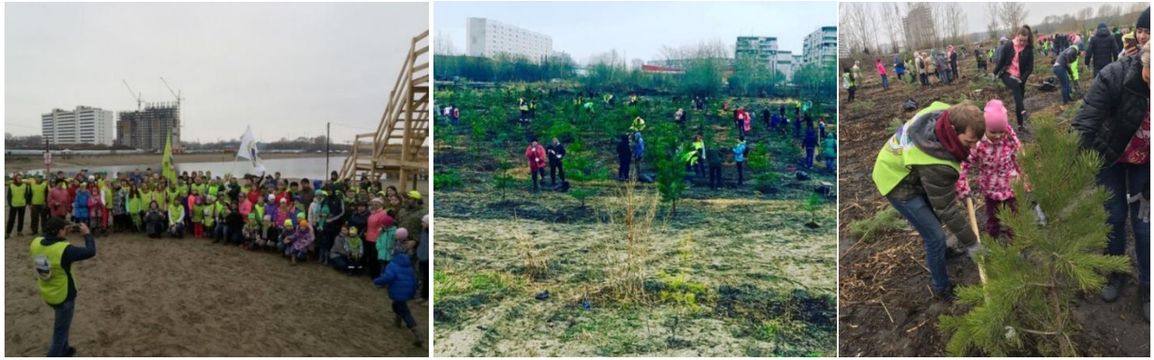
иллюстрации 6, 7, 8