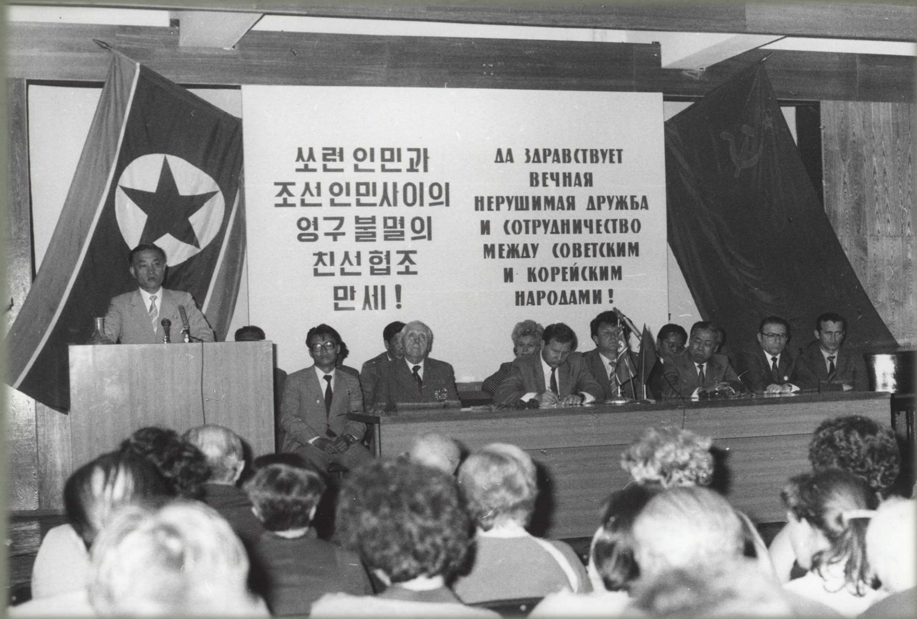
Торжественное мероприятие, посвященное встрече Корейской делегации в Новосибирске в 1985 г..