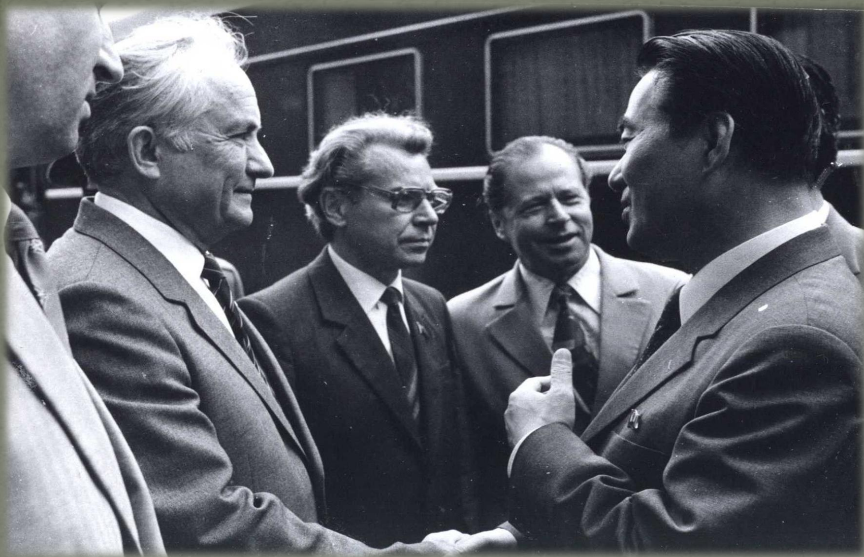
Фото из семейного альбома

Встреча первыми лицами города и области монгольской делегации в Новосибирске. Июнь, 1984