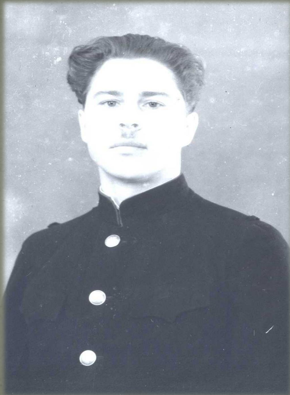
Служба в частях ВВС Советской Армии на Сахалине и Чукотке. 1946 -1950 гг.