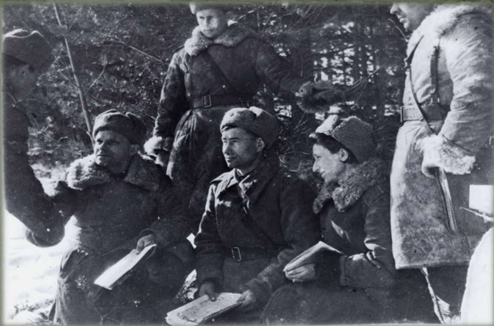
Политработники полка. (Участники, место и дата съемки неизвестны)