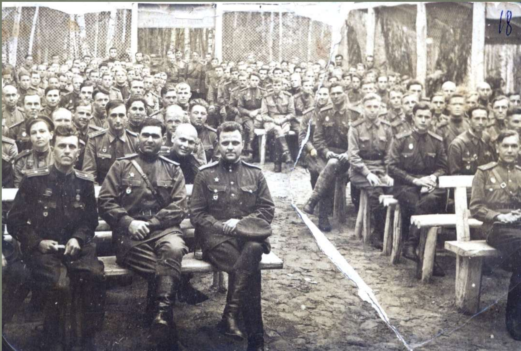
65 полк 22 Гвардейской стрелковой дивизии в Малой Поляне. 1943 год.