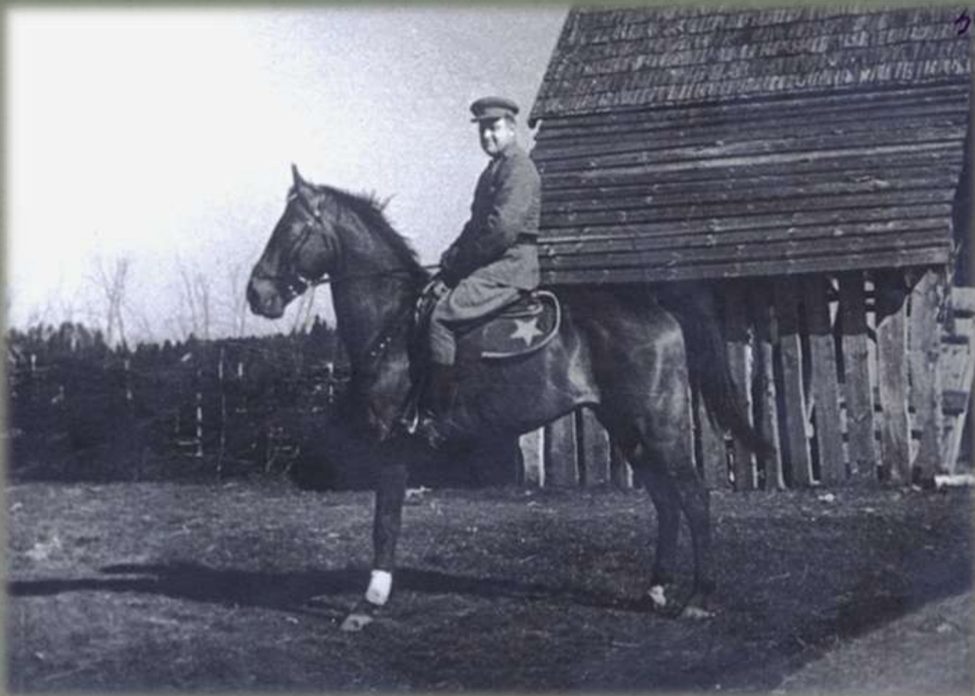
Полковник А.С. Ширяев в Латвии, май 1945 г.