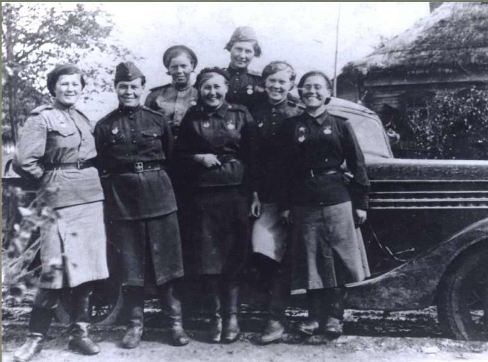
Фронтвички. (Дата, место и участники съемки неизвестны)