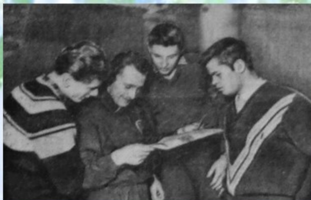
У НАС В ГОСТЯХ ХОККЕИСТЫ ГДР

21 марта - состоялась встреча одноклубников Динамо ГДР и Динамо Новосибирск. Этот международный матч с нетерпением ждали многие тысячи болельщиков - любителей хоккея с шайбой.