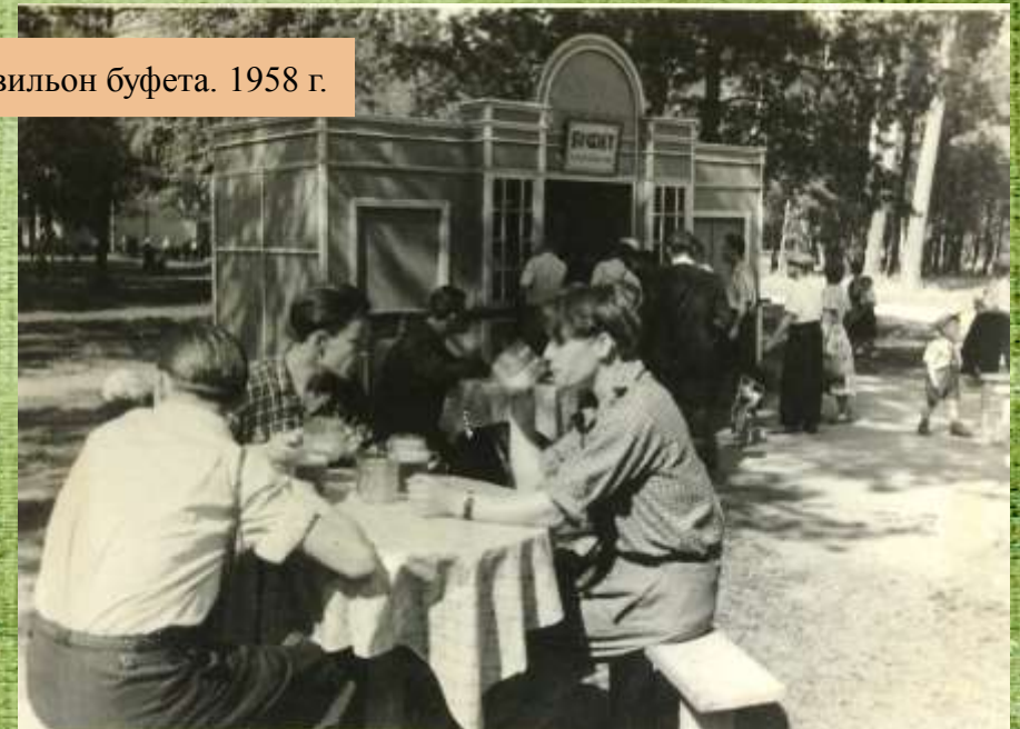
Павильон буфета. 1958 г.

На территории Заельцовского парка функционировало 2 больших ресторана на 1200 мест, две танцплощадки, работало около 100 торговых точек с летними столиками.