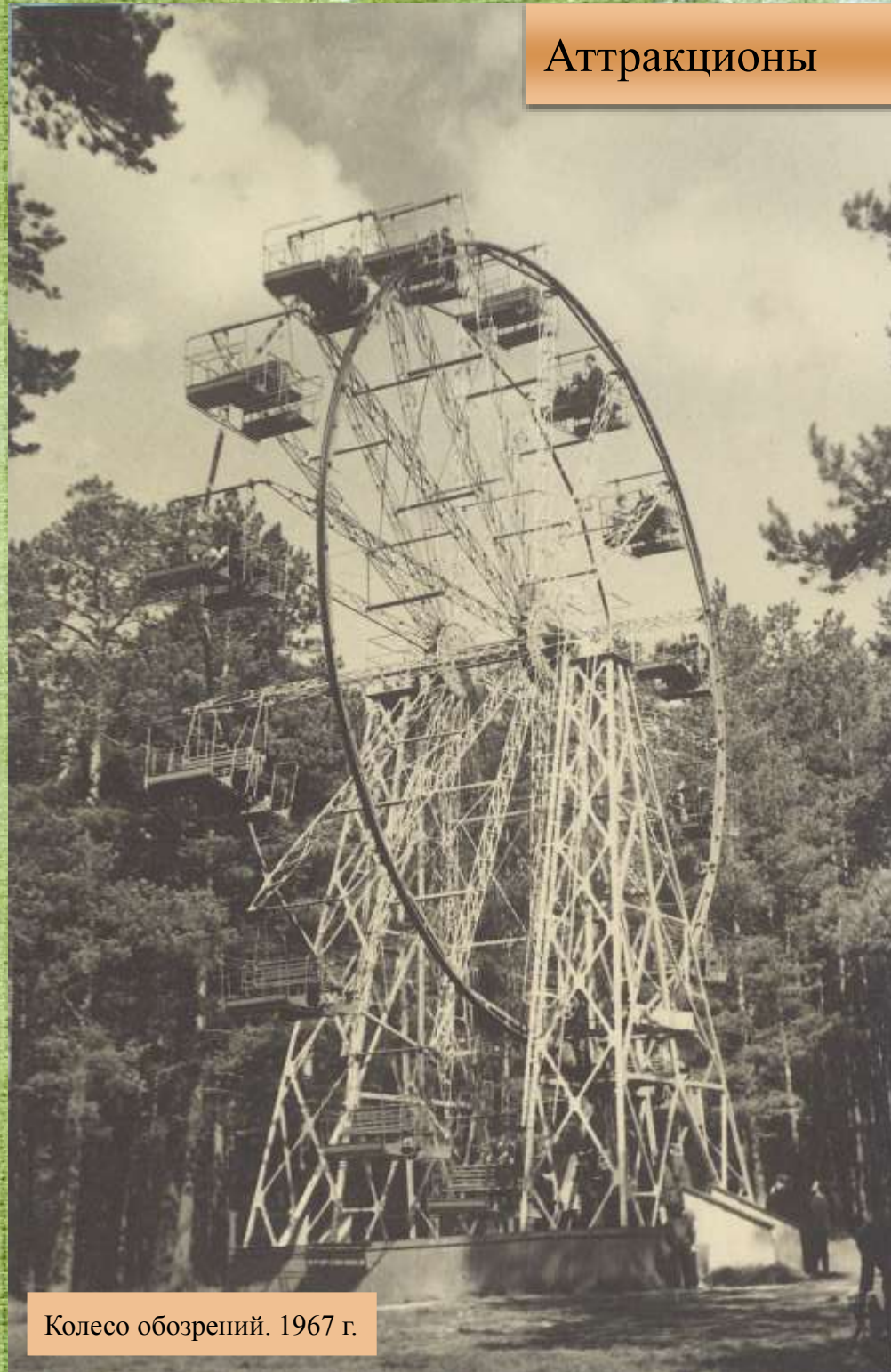
Колесо обозрений. 1967 г.