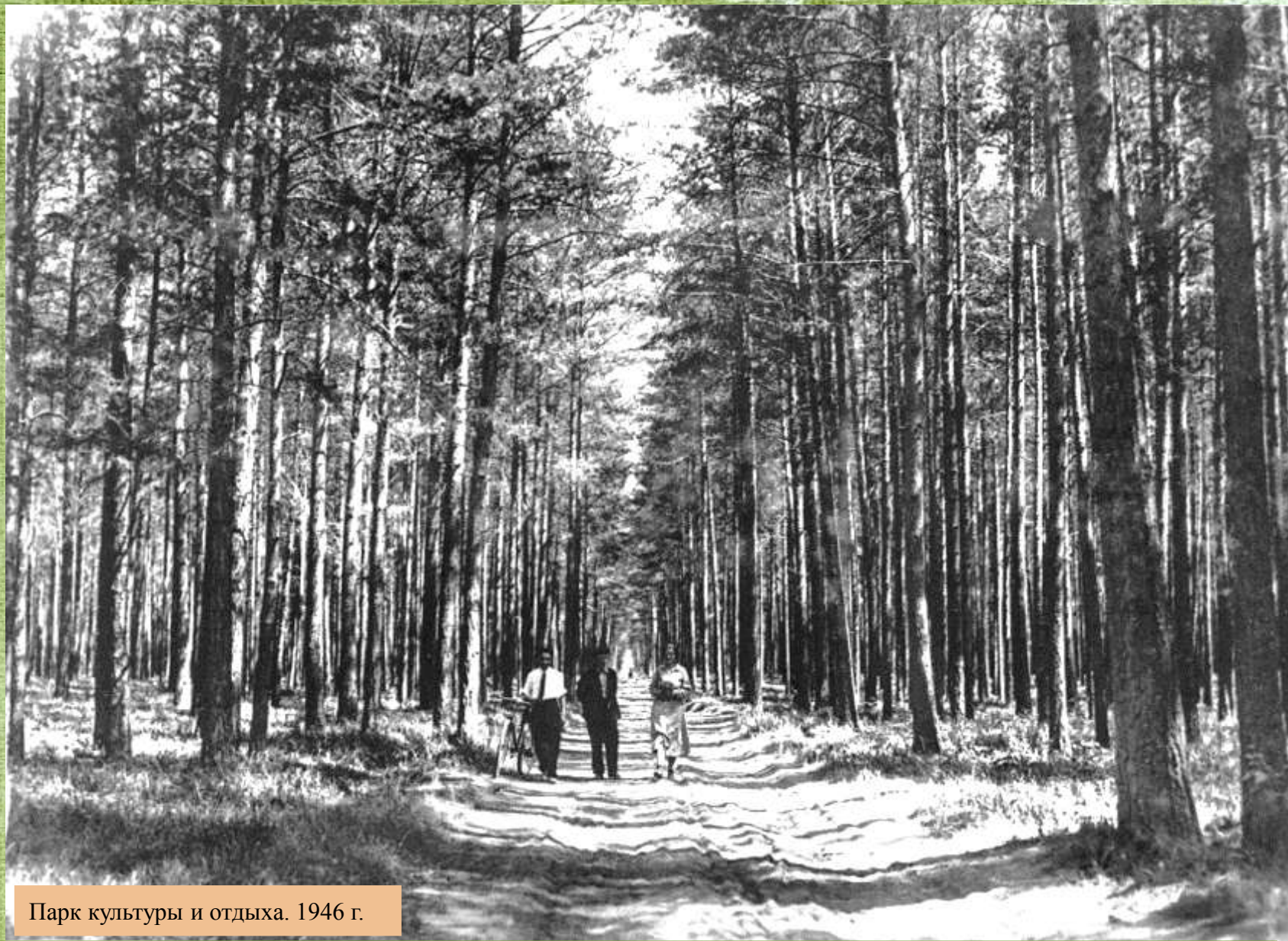
Парк культуры и отдыха. 1946 г.