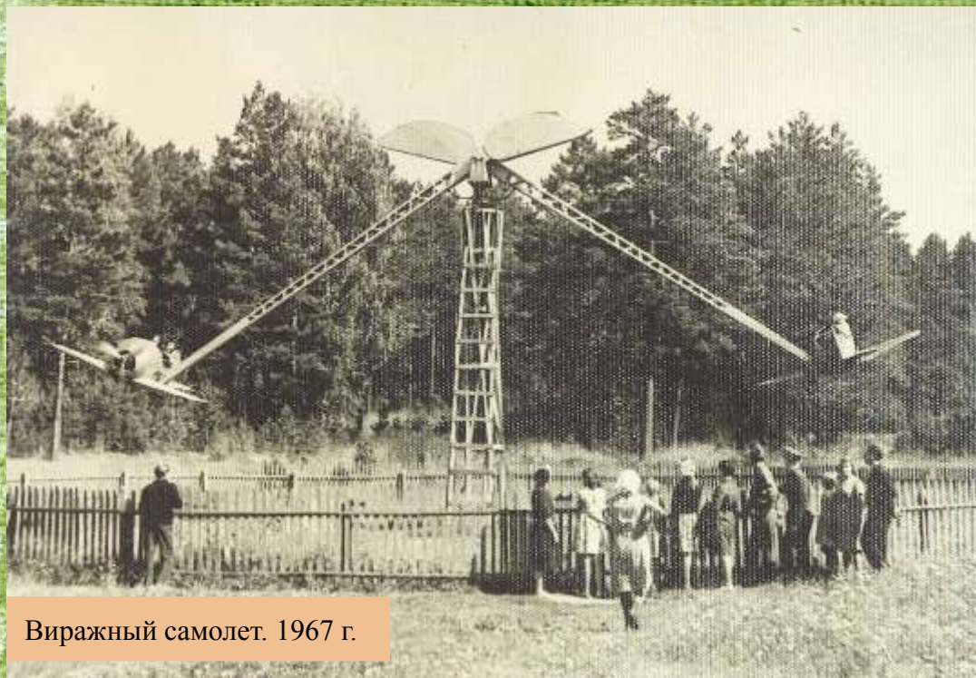
Виразный самолет. 1967 г.