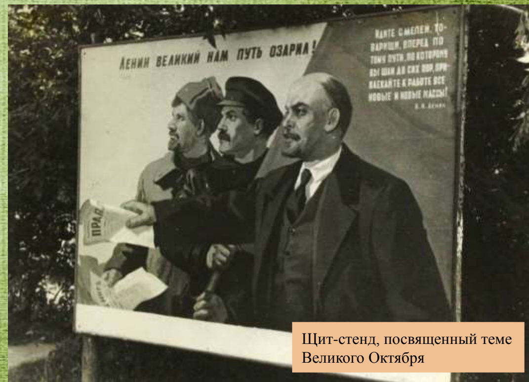
Щит-стенд, посвященный теме Великого Октября