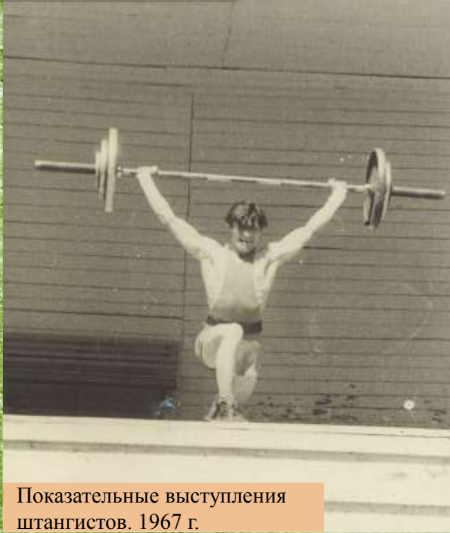
Показательные выступления штангистов. 1967 г.