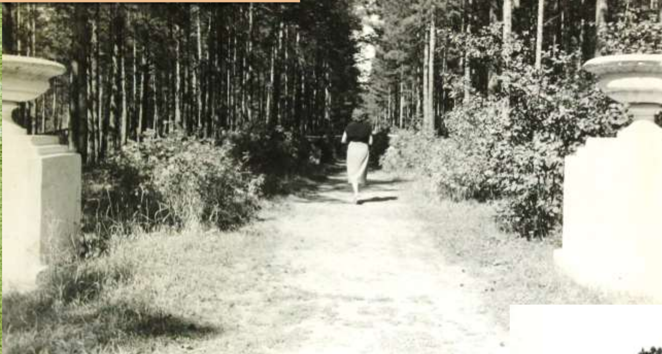
Одна из цветочных аллей парка. 1958 г.