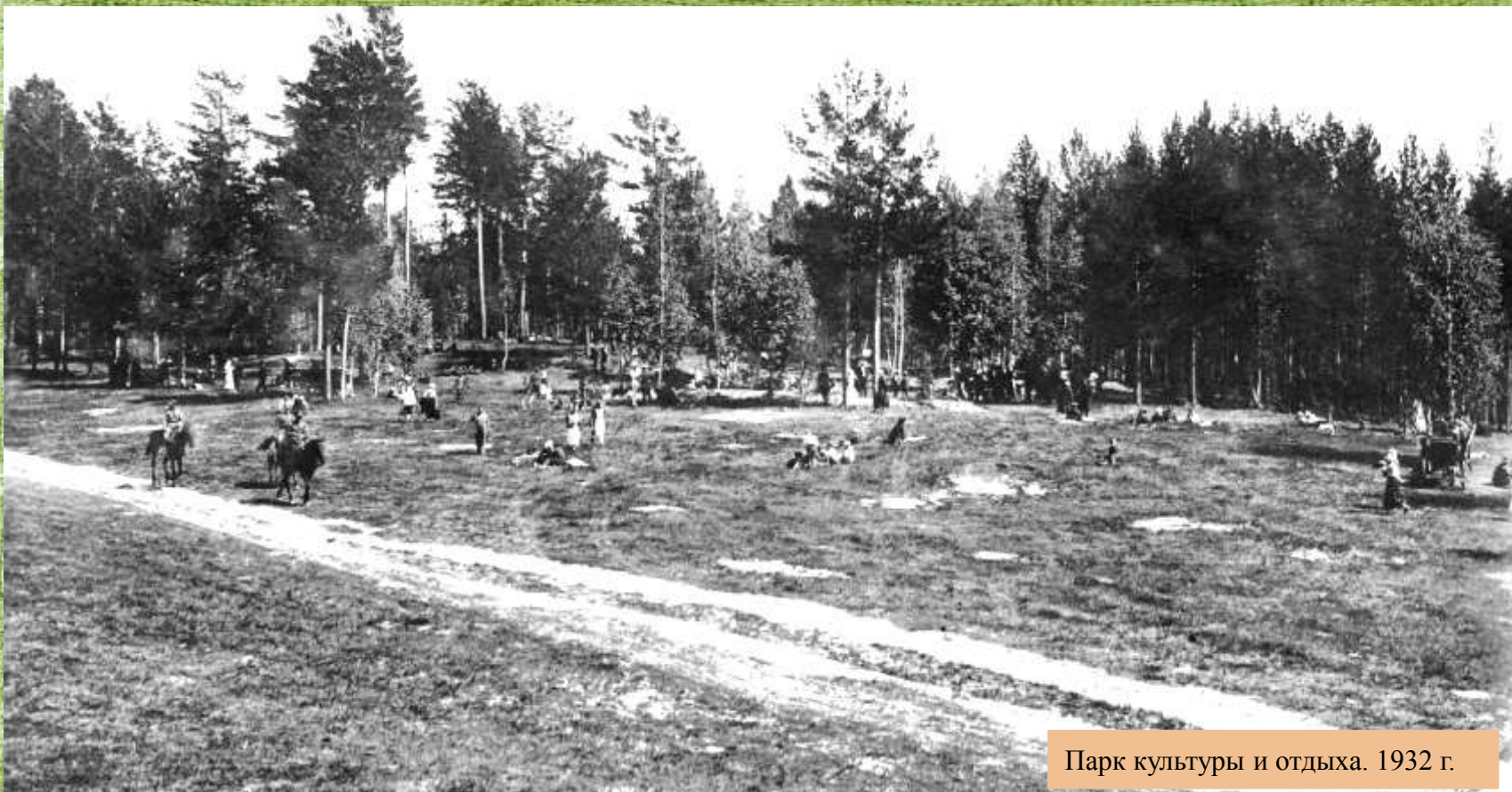
Парк культуры и отдыха. 1932 г.

Парк культуры и отдыха "Заельцовский" - один из старейших парков города Новосибирска. В связи с растущей потребностью города в расширении зоны отдыха в сентябре 1930 г. был проведен Всесоюзный открытый конкурс на составление проекта парка культуры и отдыха в г. Новосибирске. Победила программа планировки парка 1 в Ельцовской даче,