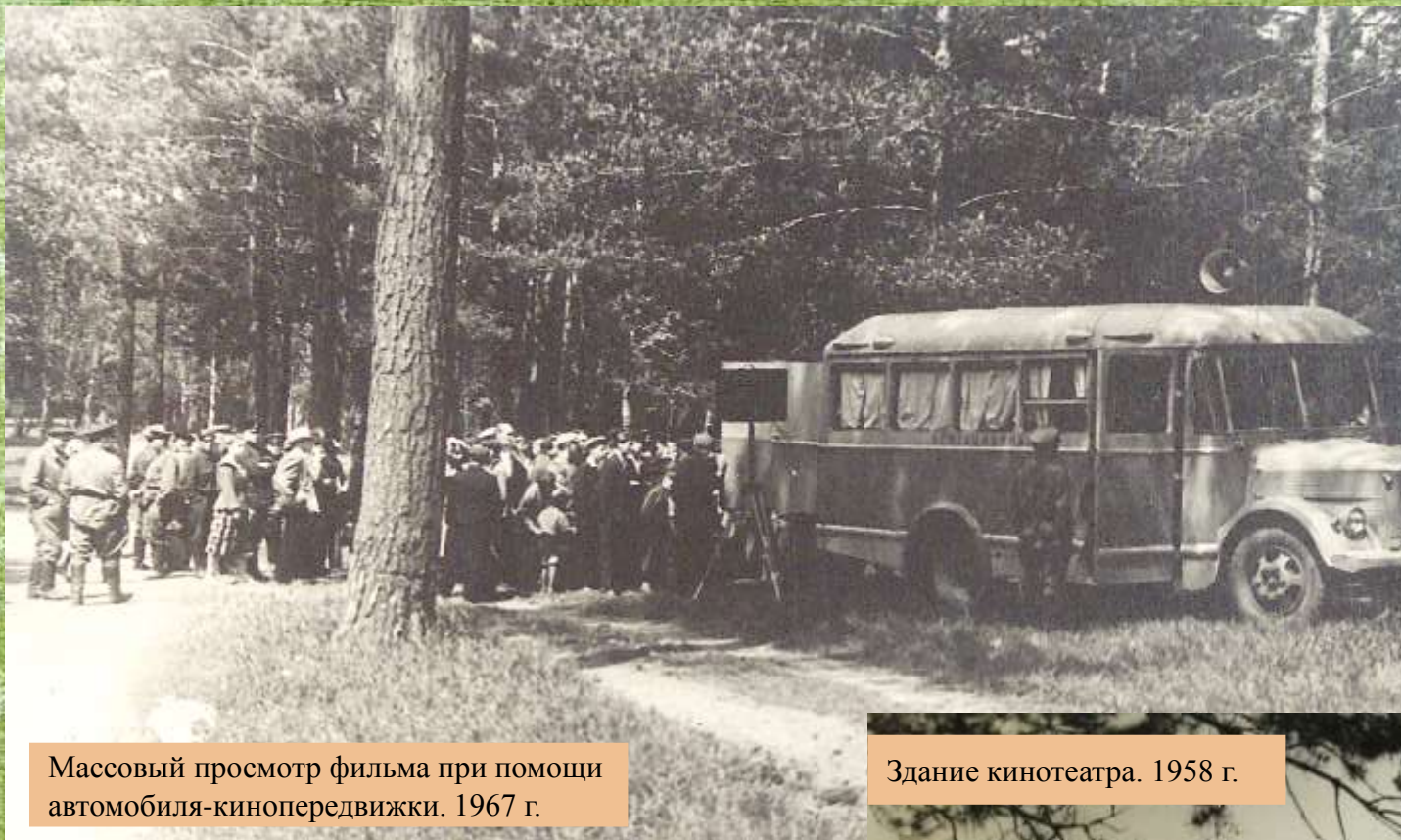
Массовый просмотр фильма при помощи автомобиля-кинопередвижки. 1967 г.

В новом Советском государстве кино было провозглашено «важнейшим из искусств», а заодно – главным средством пропаганды и агитации. История нашего государства проецировалась через призму советского кинематографа.