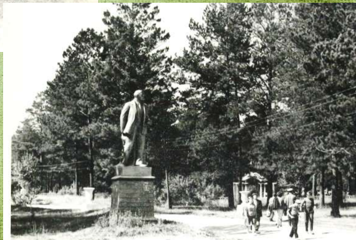
Центральная аллея парка. 1966 г.

Для утоления жажды посетителей парк окутывала сеть питьевых фонтанчиков.