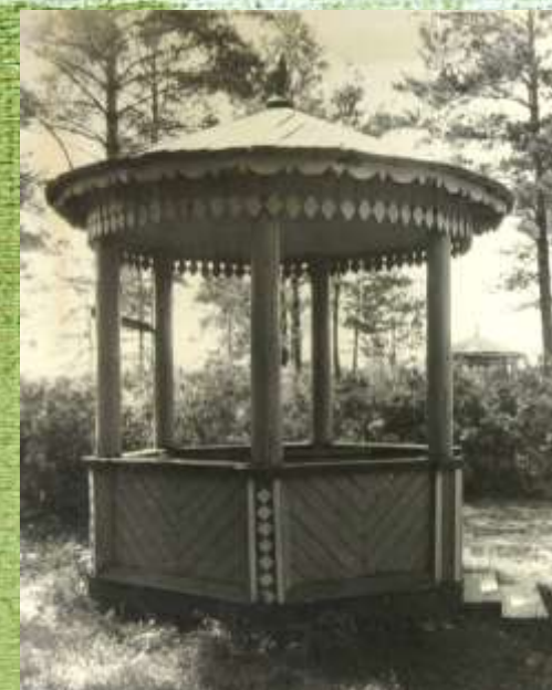
Беседка для отдыха

Зона «тихого» отдыха и прогулок включала зеленые насаждения, площадки для отдыха с легкими парковыми сооружениями — беседками.