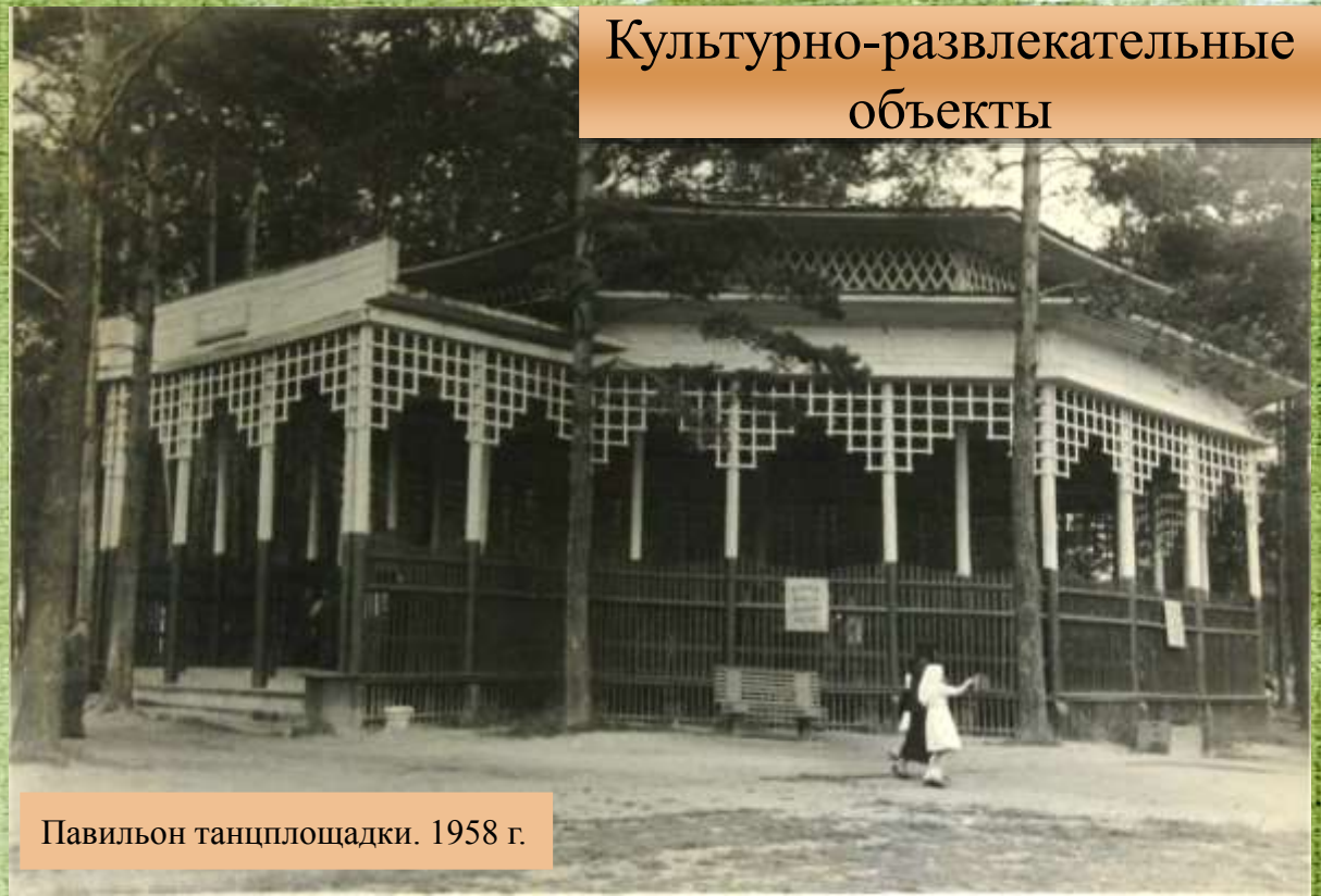
Павильон танцплощадки. 1958 г.