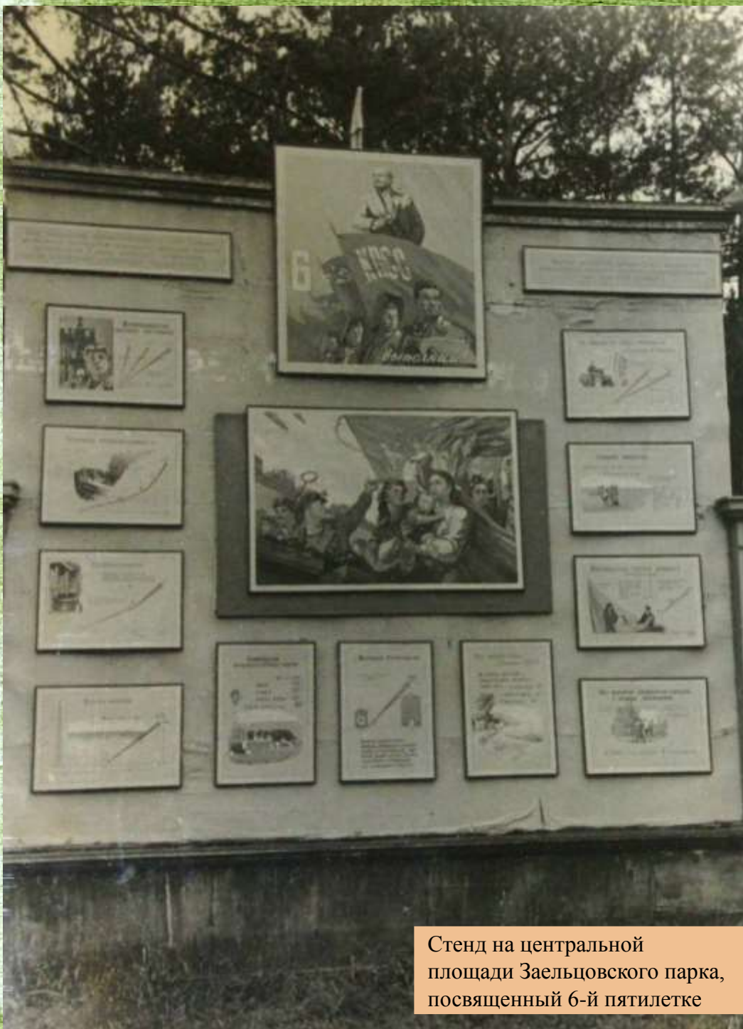
Стенд на центральной площади Заельцовского парка, посвященный 6-й пятилетке

Щит-стенд, отражающий тему Великого Октября, напоминал потомкам о славном боевом прошлом нашего Отечества, героических делах отцов и дедов.