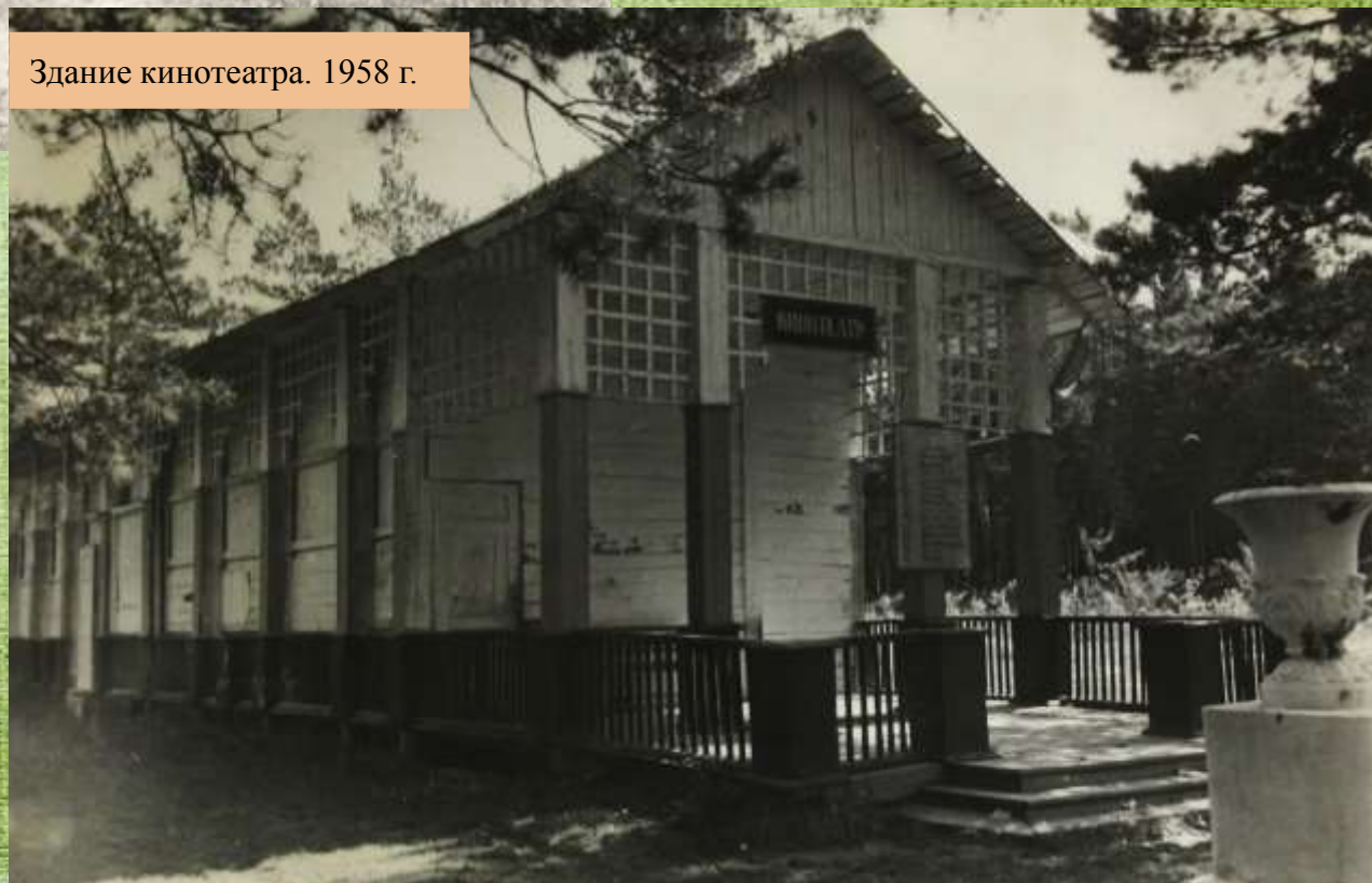
Здание кинотеатра. 1958 г.

Распространенной практикой была организация коллективных просмотров фильмов при помощи автомобиля-кинопередвижки.