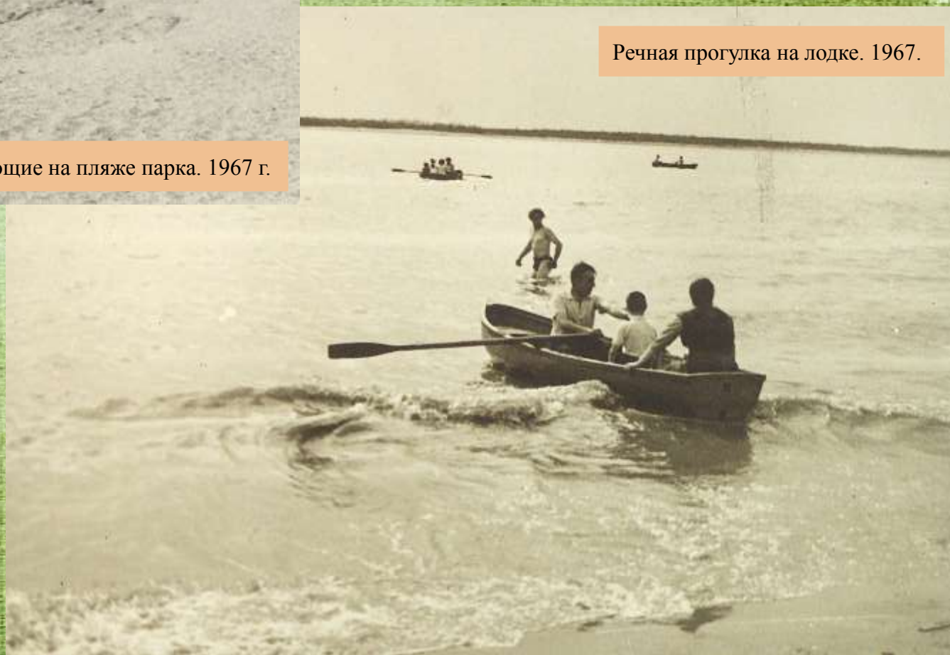
Речная прогулка на лодке. 1967.

В парке функционировала лодочная станция, где можно было взять на прокат лодку. На пляже дежурили спасатели, гарантируя отдыхающим безопасное плавание.