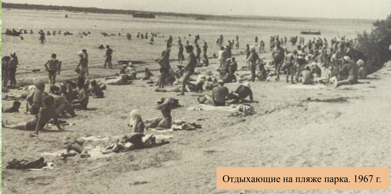
Отдыхающие на пляже парка. 1967 г.

Протянувшиеся вдоль пляжа зонтики-грибки и кабинки для переодевания обеспечивали комфортный отдых горожанам.