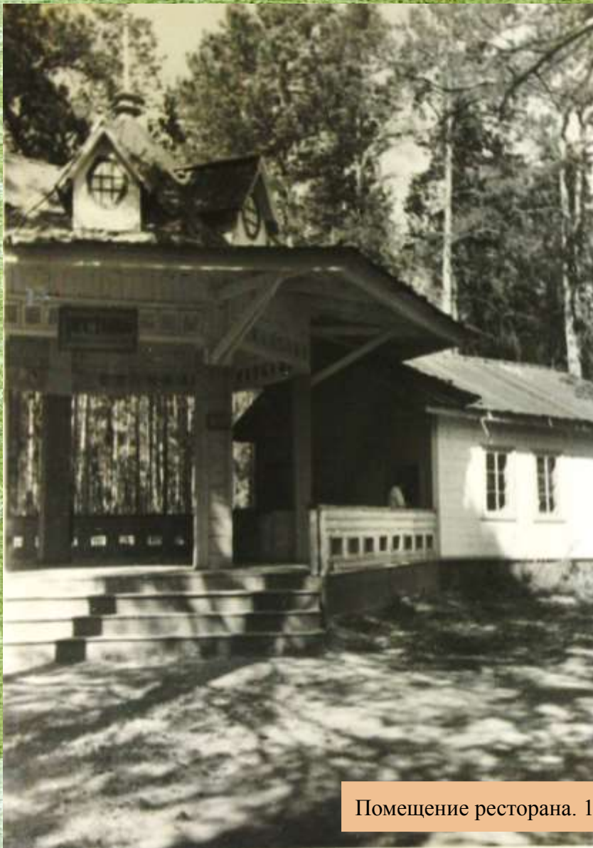
Помещение ресторана. 1958 г.