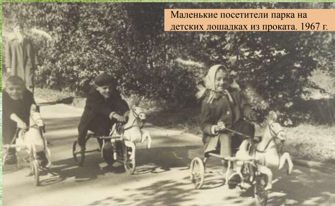
Маленькие посетители парка на детских лошадках из проката. 1967 г.