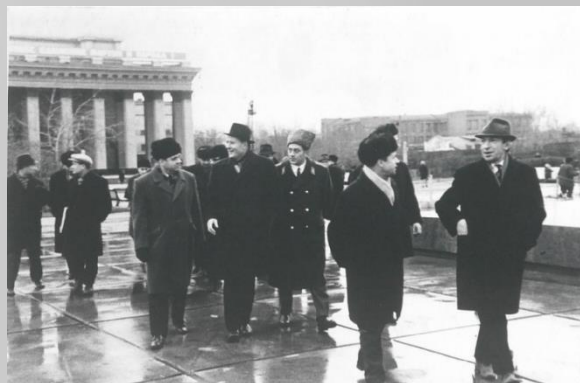
Фотографии из документации приемной комиссии памятника В.И. Ленину в г. Новосибирск