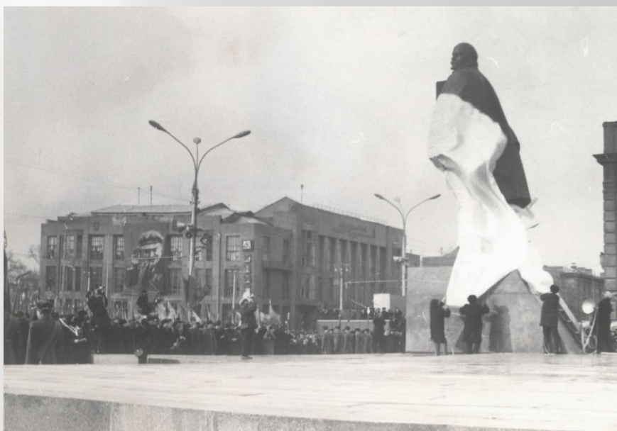
Фотографии из тематического фотоальбома об открытии в Новосибирске памятника В.И. Ленину к столетию со дня рождения вождя