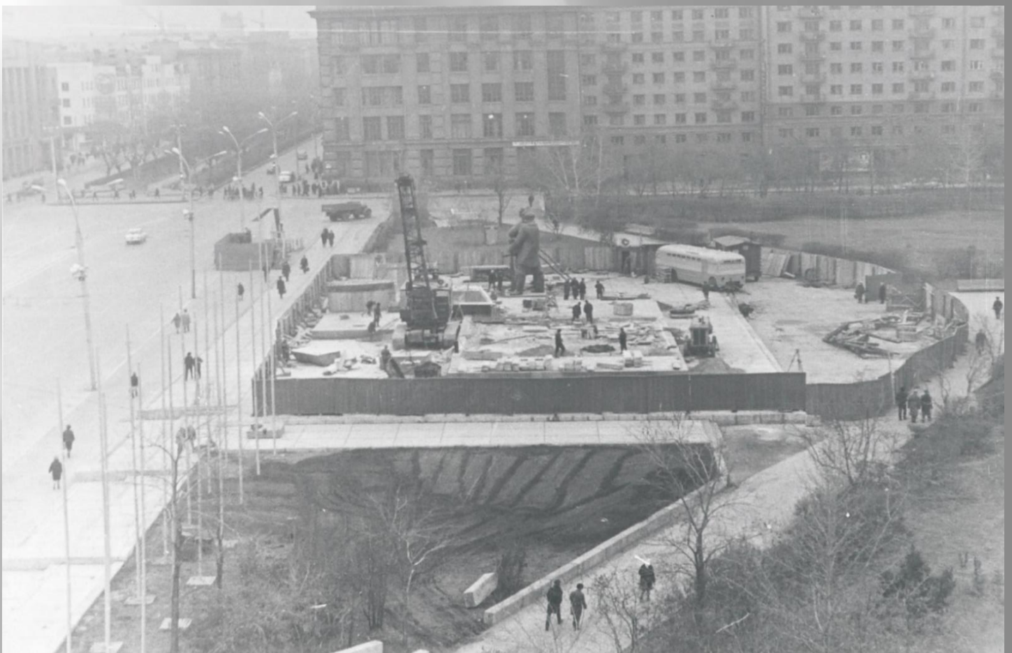
Площадка строительства монументальной композиции – памятника В.И. Ленину на площади им. Ленина. Вид от ул. Депутатской

Несколько раз срывались сроки поставки гранитных изделий, что создавало серьезную угрозу установки его к 100-летию со дня рождения В.И. Ленина. Неоднократные обращения председателя Новосибирского горисполкома И. Севастьянова, направленные в различные инстанции, дали свои плоды. 27 мая 1970 года Министерство культуры РСФСР и Секретариат Правления Союза художников РСФСР сообщили, что Мытищенский и Ленинградский заводы художественного литья обеспечат выполнение памятника В.И. Ленина для города Новосибирска к 7 ноября 1970 года.