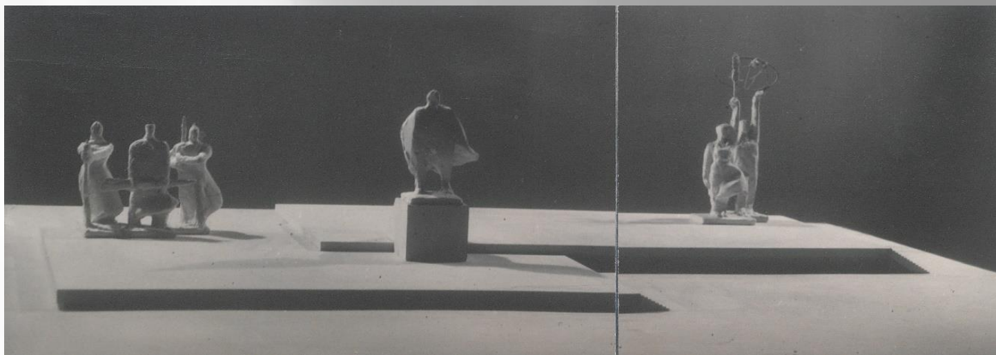
Макет памятника В.И. Ленину в г. Новосибирске (на площади им. Ленина)

11 сентября 1957 года исполнительным комитетом Новосибирского городского Совета депутатов трудящихся была утверждена программа открытого конкурса на разработку проекта памятника В.И. Ленину на центральной площади города Новосибирска.