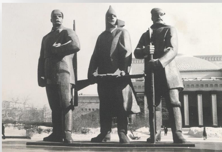
Фотографии из тематического фотоальбома об открытии в Новосибирске памятника В.И. Ленину к столетию со дня рождения вождя