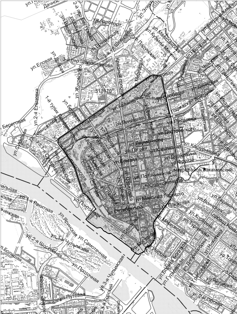
СХЕМА границ территории центральной части города Новосибирска