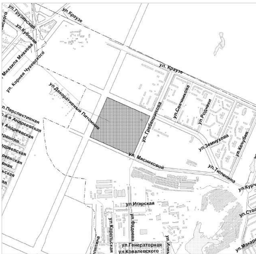
Схема границ проекта межевания земельного участка с кадастровым номером 54:35:041060:2 в границах проекта планировки жилого района «Родники» в Калининском районе