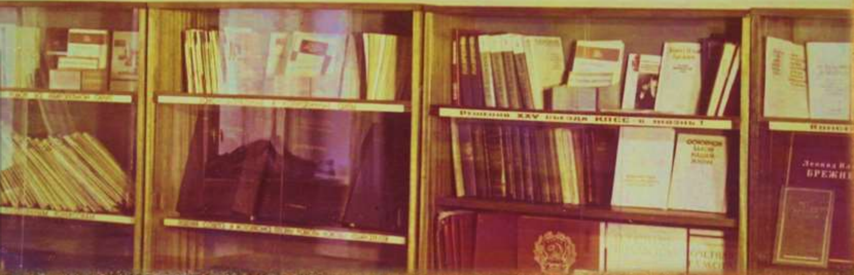
Тематический стенд в Железнодорожном райисполкоме, посвященный Конституции СССР. 1979 г.

Статья 28. Народные депутаты избираются на территории городов и районов Советского Союза на основе всеобщего избирательного права. Статья 29. Народные депутаты избираются на территории городов и районов Советского Союза на основе всеобщего избирательного права. Статья 30. Народные депутаты избираются на территории городов и районов Советского Союза на основе всеобщего избирательного права.