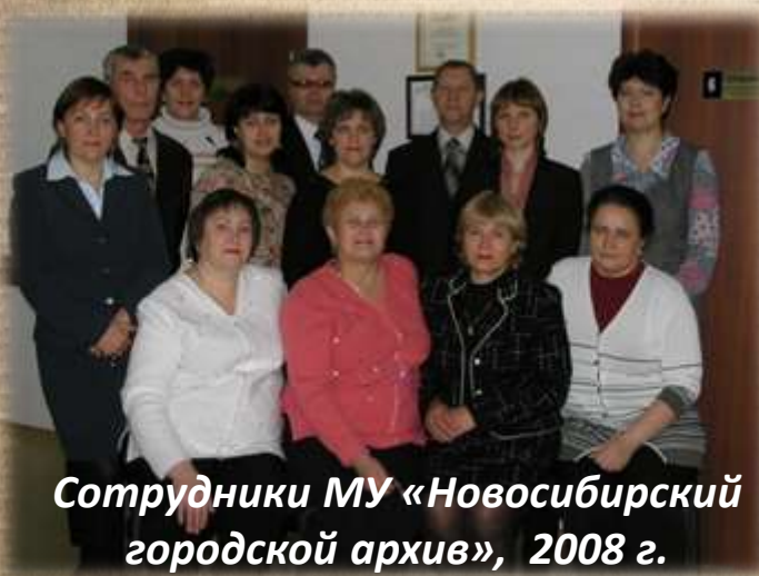
Сотрудники МУ «Новосибирский городской архив», 2008 г.

В 70-ые годы, после переезда архива в нынешнее помещение, в архиве работали 4 сотрудника. С увеличением объема хранящихся документов, с появлением новых задач, таких как, например, создание электронного архива, постепенно растет штатная численность учреждения.