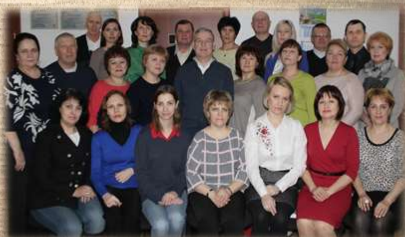
Сотрудники МКУ «Новосибирский городской архив» 2018 г.