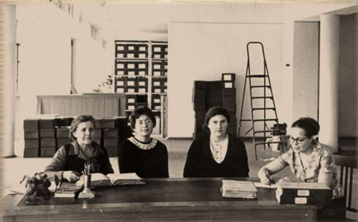
Сотрудники Новосибирского городского государственного архива в новом помещении архива. 1968 г.

Сегодня в Новосибирском городском архиве 6 хранилищ документов. Все они оснащены специальным оборудованием для обеспечения температурно-влажностного, охранного режимов хранения.